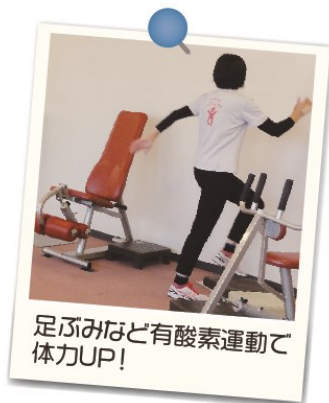
足踏みなど有酸素運動で体力UP!