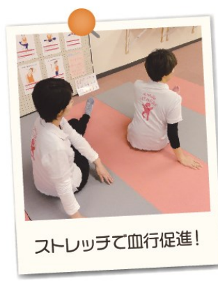
ストレッチで血行促進!