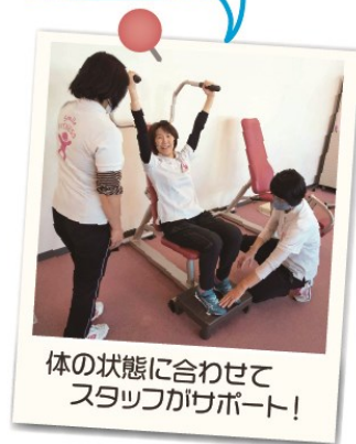
体の状態に合わせてスタッフがサポート!