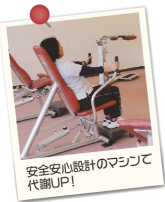
安全安心設計のマシンで代謝UP!